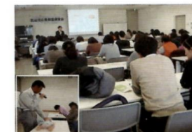
乳幼児応急救護講習会 (平成 25 年 1 月 27 日実施)