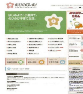
小金井子育て・子育て支援サイト「のびのびーの!」トップページ

子育て支援サイトの管理・運営を継続し、より利用価値のある、親しみやすいサイトとするために、利用者の意見などを基に改良を加え、様々な手段で PR していく。子育て・子育てに関する講演会・学習会等も継続的に開催する。「小金井子育て・子育てパートナーシップ宣言」の広報・普及活動の実施。その他、「キッズカーニバル KOGANEI」の共催や、協議会構成団体を中心とした交流会を開催する予定である。