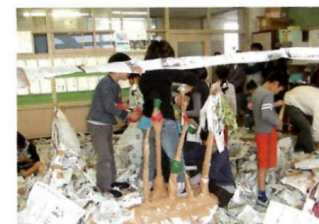
子育て活動団体に対する活動経費の助成事業のうち、NPO 法人遊び文化 NPO 小金井こらぼ の「ガッコラボ (学生による学校現場における造形指導)」